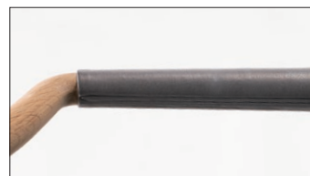
肘巻き 標準仕様・アップグレード仕様(布・皮革の場合) パイピング仕上げ

背パイピングと肘巻きは標準仕様ではクッションの張地と同素材になりますが、アップグレードが可能です。肘巻きの仕様は標準仕様・アップグレード(布・皮革)とアップグレード(厚革)で異なります。