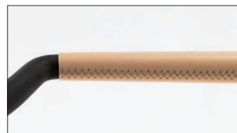
肘巻き アップグレード仕様(厚革の場合) ハンドステッチ (手縫い) 仕上げ