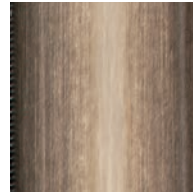
AB (ANTIQUE BRASS) アンティークブラス