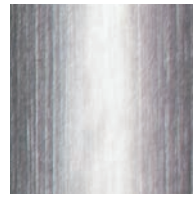
HL (SHINY HAIRLINE) シャイニーヘアライン

ステンレススティールは日本の伝統色をベースに生まれた味わい深い色味を中心に展開された、全6色。表面に薄く塗料を載せ、ヘアライン加工の表情を覗かせる工夫を施すことで、冷たくなりがちなステンレススティールの表情に穏やかさをプラスし、色合いに奥行きを感じさせています。ステンレススティール特有の高級感のある質感が、既存のアイテムに新しい息吹を吹き込みます。