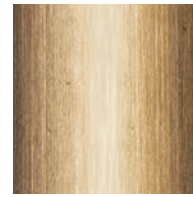
BS (SHINY BRASS) シャイニーブラス