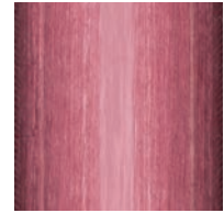
CR (CLASSIC ROSE) クラシックローズ