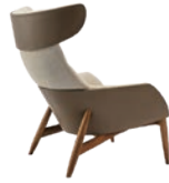
HIGH-BACK EASY CHAIR (MEDIUM)