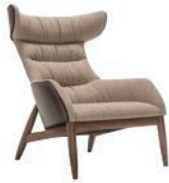
HIGH-BACK EASY CHAIR (LARGE)