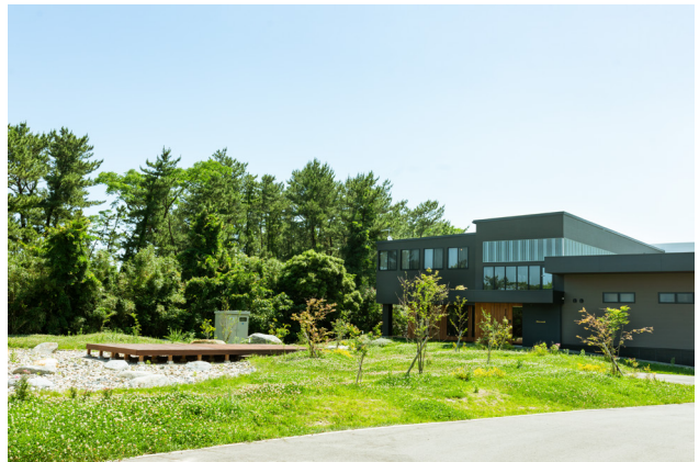
ITOSHIMA SEASIDE FACTORY