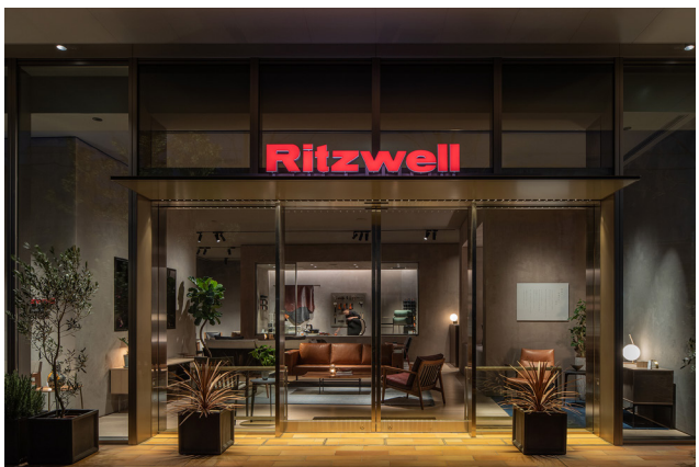
Ritzwell 表参道 SHOP & ATELIER