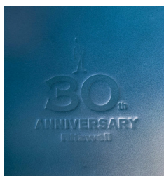
<刻印 : 30th ANNIVERSARY>