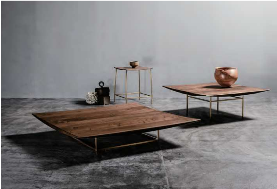
IBIZA FORTE livingtable, sidetable

リッツウェルの家具は、フォルムの美しさを最大限に引き出す卓越した素材使いが特徴の一つです。素材とフォルム。その二つが互いの存在を高めあうことで、デザインに独特の味わいと有機的な美しさをもたらすという考えの下、常に素材を生かすための様々な試みを行っているリッツウェルでは、このたび新たに日本の伝統色をベースにしたステンレススティール（6色）と、植物タンニン鞣しの厚革に新色（2色）を追加しました。