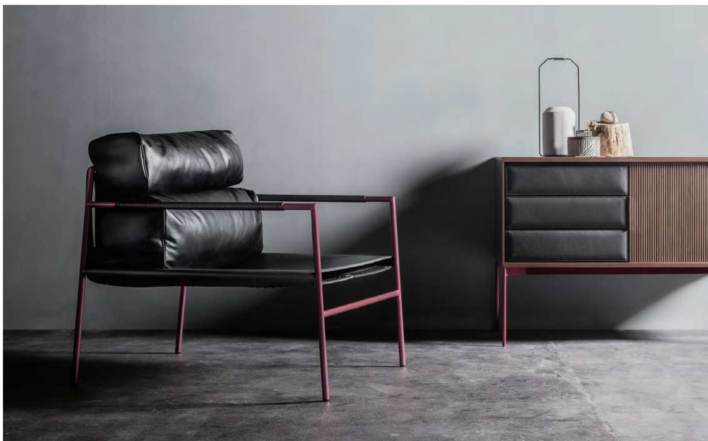
IBIZA FORTE easychair JK893 厚革ブラック / フレーム クラシックローズ

リッツウェルのコアコンセプトの証しともいえる、IBIZA FORTE イージーチェア。15年の時を越え新たな可能性を繙き復刻します。