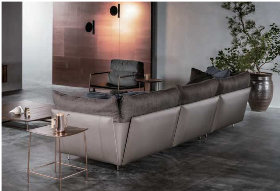
LIGHT FIELD modular sofa