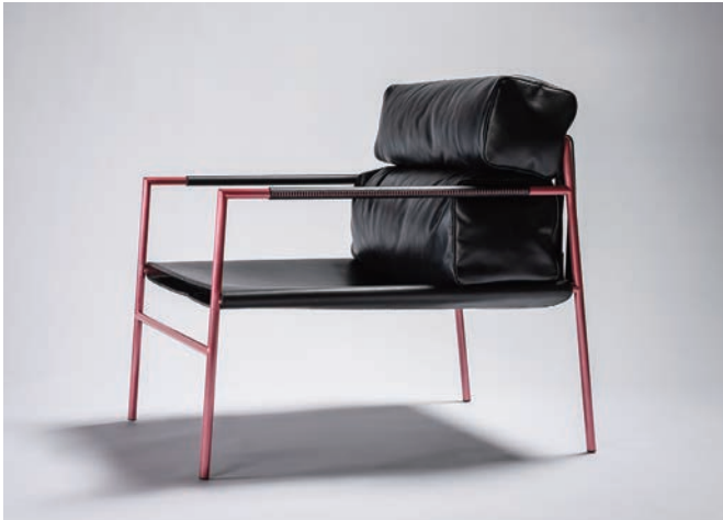
FRAME COLOR: CLASSIC ROSE