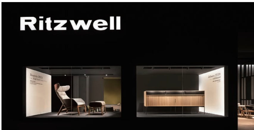
SALONE DEL MOBILE.MILANO 2018 HALL 5 / D14

既存色のスティールブラックに、ステンレススティールの無機質なイメージを一掃する新たな6色が加わりました。リッツウェルが新たに採用したのは、日本の伝統色をベースにした古美色仕上げ。ステンレススティールの表面に薄く塗料を載せ、ヘアライン加工の表情を覗かせる工夫を施すことで、冷たくなりがちな素材に穏やかな風合いをプラスし、有機的で落ち着いたある上品な美しさに仕上げています。