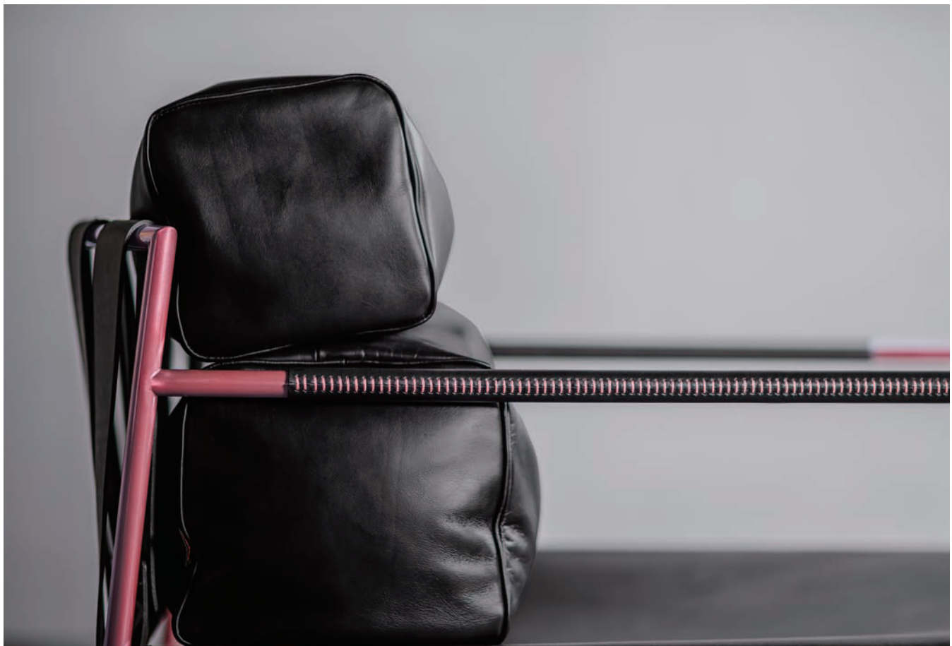
IBIZA FORTE EASY CHAIR

本国イタリアのハイエンドブランドで占められるフィエラ本会場 HALL 5。ヨーロッパの名だたる有名ブランドがひしめく最も注目度の高いロケーションに、4年連続アジア企業では唯一のブランドとしてリッツウェルの出展が決定いたしました。さらに、前回の高評価を受けて、11回目の出展となる今回、展示スペースは前回の150㎡から1.5倍の220㎡の広さに拡張されました。昨年とはまた違った趣向でリッツウェルの新たな魅力を伝えます。