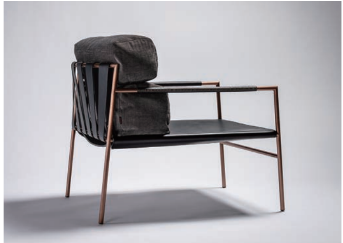
FRAME COLOR: SHINY BRONZE