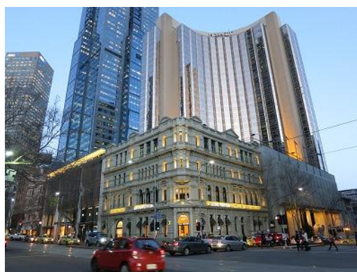
Stylecraft（レンガ建物）と周辺のメルボルン市街風景

イベント期間中、Stylecraft ショールームには多くのお得意さま、デザイナーやプレスの方々が絶え間なく来場され、私たち Ritzwell を含め、今回展示されたブランドと商品についての話題が尽きませんでした。